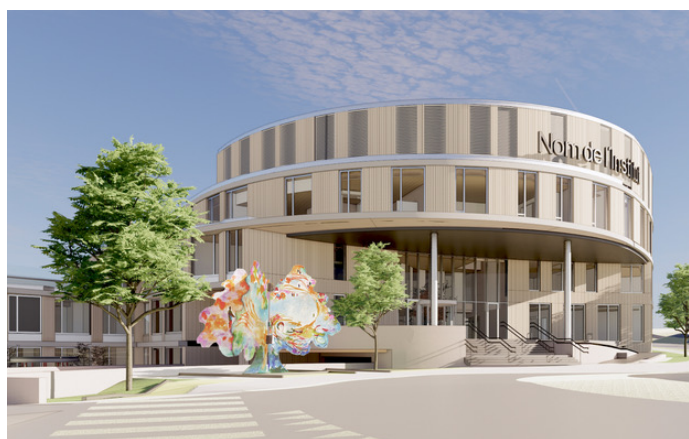
Simulatie van de toekomstige Levensboom, 2023